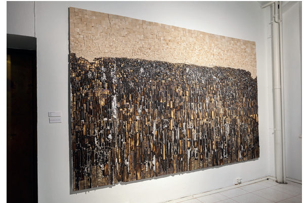
Horizon, Kuvan kevät

Ruumiillinen läsnäolo ja käsien liikkeet ovat aktiivinen osa luovaa prosessia, käsillä työskentely ei ole siis ainoastaan mekaanista ideoiden toteutusta. Käsissäni ja koko kehossani on runsaasti tietoa ja taitoa, joka ohjaa ja vaikuttaa tekemisiini. Haluan myös antaa niille tilaa taiteessani. Kielellisillä käsitteillä ja merkityksillä ei ole suurtakaan roolia taiteessani, usein ne tulevat kyseeseen vasta teoksen jo valmistuttua, kun tekemistä pitää sanoittaa muille. Useimmat teokset saavat alkunsa mielikuvista ja niihin liittyvästä kokemuksellisesta tunteesta siitä, miltä voisi tuntua olla teoksen äärellä. Olennaista on myös ajatus taiteesta kohtaamisena, niin materiaalien tasolla kuin tekijän ja materiaalin välillä. Kohtaamisen teema liittyy myös taiteen vastaanottamiseen. Käsitteen materia etymologia on kiinnostava taiteeni kannalta, koska käsite materia juontaa juurensa latinan sanasta māteria, joka on johdettu sanasta māter (äiti) merkityksessä 'alkuperä' (wiktionary.org).