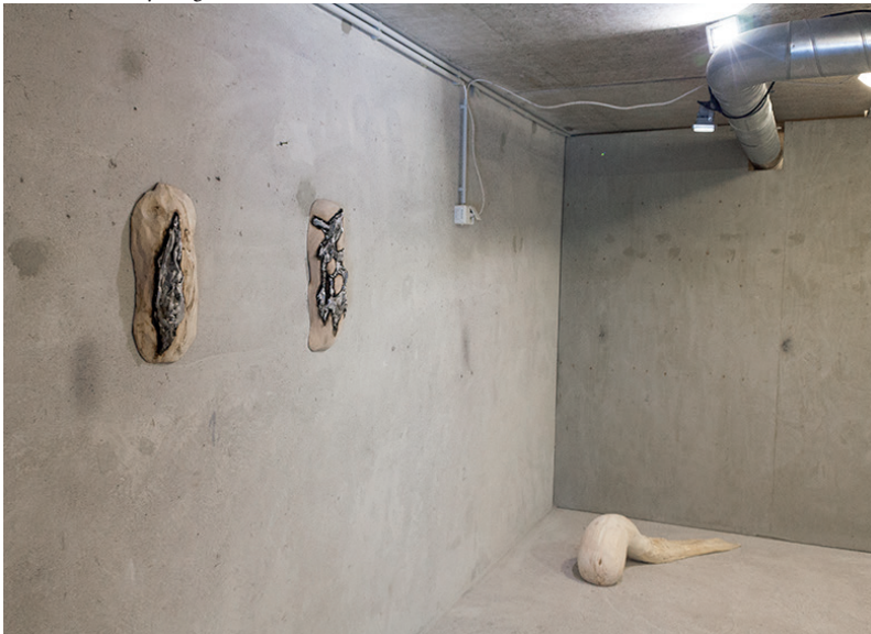
Näkymä gallerian ovelta