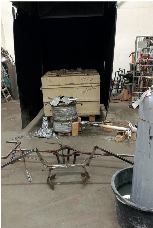
Horizon teoksen elementtien valamista.