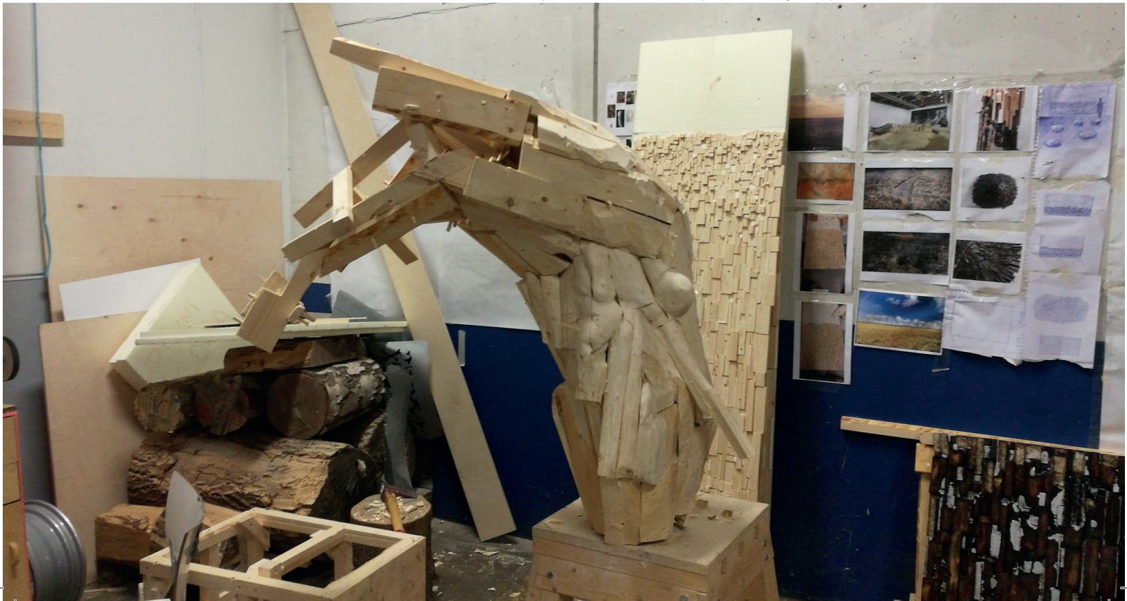
Työhuone kuva. Keskellä Experimental Organism ja seinää vasten osia teoksesta Horizon

Kielellisyyden ylikorostunut asema johtaa siihen, että teos itsessään, materiaalisena objektina on toissijainen. Tärkeimmäksi muodostuu se mitä teos edustaa, mitä se merkitsee, miten siitä voidaan keskustella. Taideteos irtoaa sen tekoprosessista ja sen materiaalisuudesta. Molemmat nähdään vain toisarvoisina rakennuspalikoina. Kielellisyyden ylikorostunut asema tekee prosessista liian yksiuotteisen ja jossakin mielessä jopa tarpeettoman. Työskentelyprosessi pelkistyy vain mekaaniseksi toteutukseksi, joka voidaan vaikka ulkoistaa.