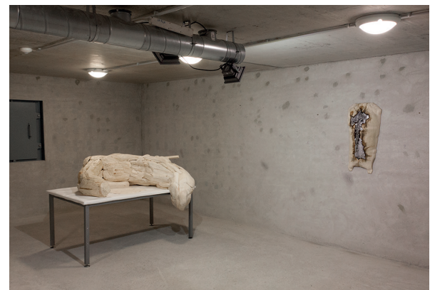
Experimental organism ja Core, Wood/flesh