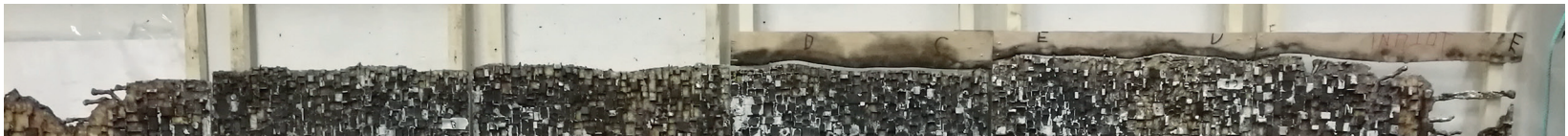
Yksityiskohta teoksesta Horizon tekovaiheessa

Tarkoitukseni ei ole nostalgisoida, että ennen kaikki oli paremmin kuin nyt. Luontosuhteemme on kuitenkin muuttunut, uskon tämän muutoksen johtuvan pitkälti myös siitä, että tietoisuus luonnon haavoittuvuudesta on kasvanut. Tätä nykyä monet ymmärtävät ristiriidan länsimaisen kulutusyhteiskunnan ja luonnon kestävyuden kannalta. Luonnosta on tullut jotain arvokasta, jotakin joka voi kadota. Jotakin jonka pariin voidaan mennä ja josta voidaan nauttia. Luonnosta on tullut sen katoamisen uhan myötä kiinnostava. Se on menettänyt sen itsestään selvän olemassaolon statuksensa, joka sillä joskus ehkä on ollut. Laajalle levinnyt huoli luonnon tilasta ja tietoisuus siitä, että meidän tapamme elää on vaaraksi luonnolle ovat keskenään ristiriidassa. Tästä seuraa ahdistus; onko minun tapani elää vaaraksi jollekin, onko se, että elän kuten muutkin ympärilläni haitallista? Helpoin tapa ratkaista tämä ahdistus on yrittää kieltää koko ongelma, en halua ajatella sitä, en ota kantaa. Ympäristön pilaantumisen ongelma on niin syvällä meidän länsimaisen yhteiskuntamme ytimessä, että sen ratkaiseminen vaikuttaa lähes mahdottomalta. Yksi mahdollinen tulkinta Horizon teokselle on lukea sitä tämän kaltaista pohdintaa vasten. Se on lohduton maisema luonnosta ja meidän suhteestamme siihen.