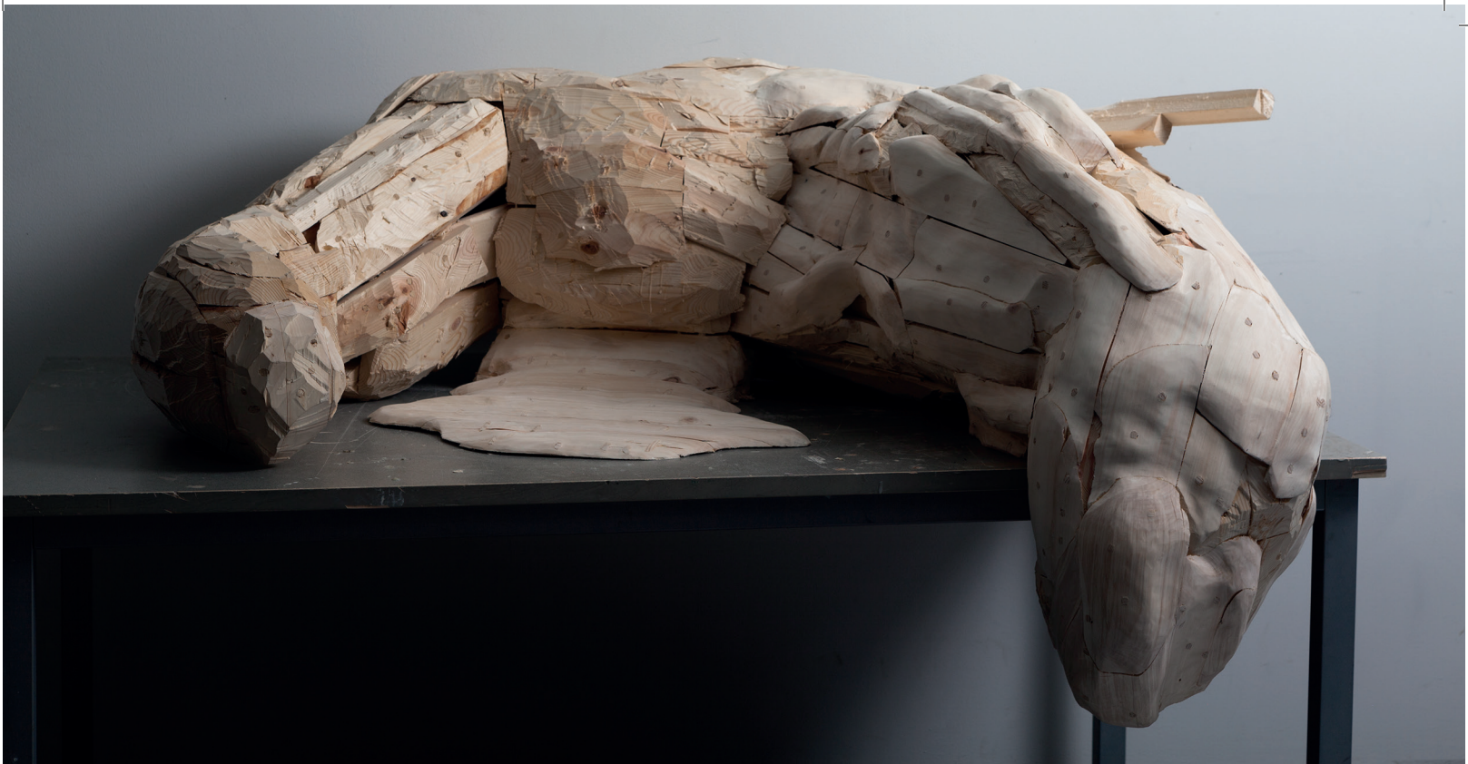
Experimental Organism teoskuva