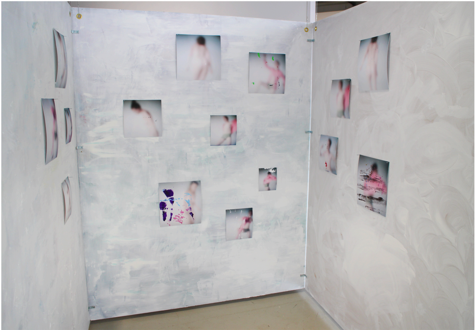
Hurmos ja hulluus teoksen sisäpuoli