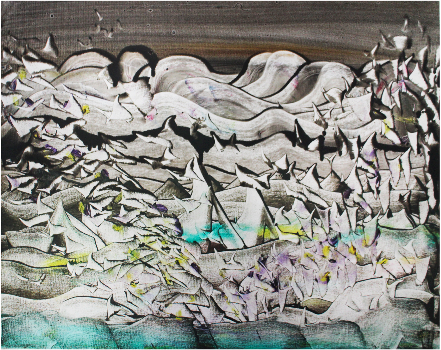
Meren harmaus 2013 öljy kankaalle 84 x 64 cm