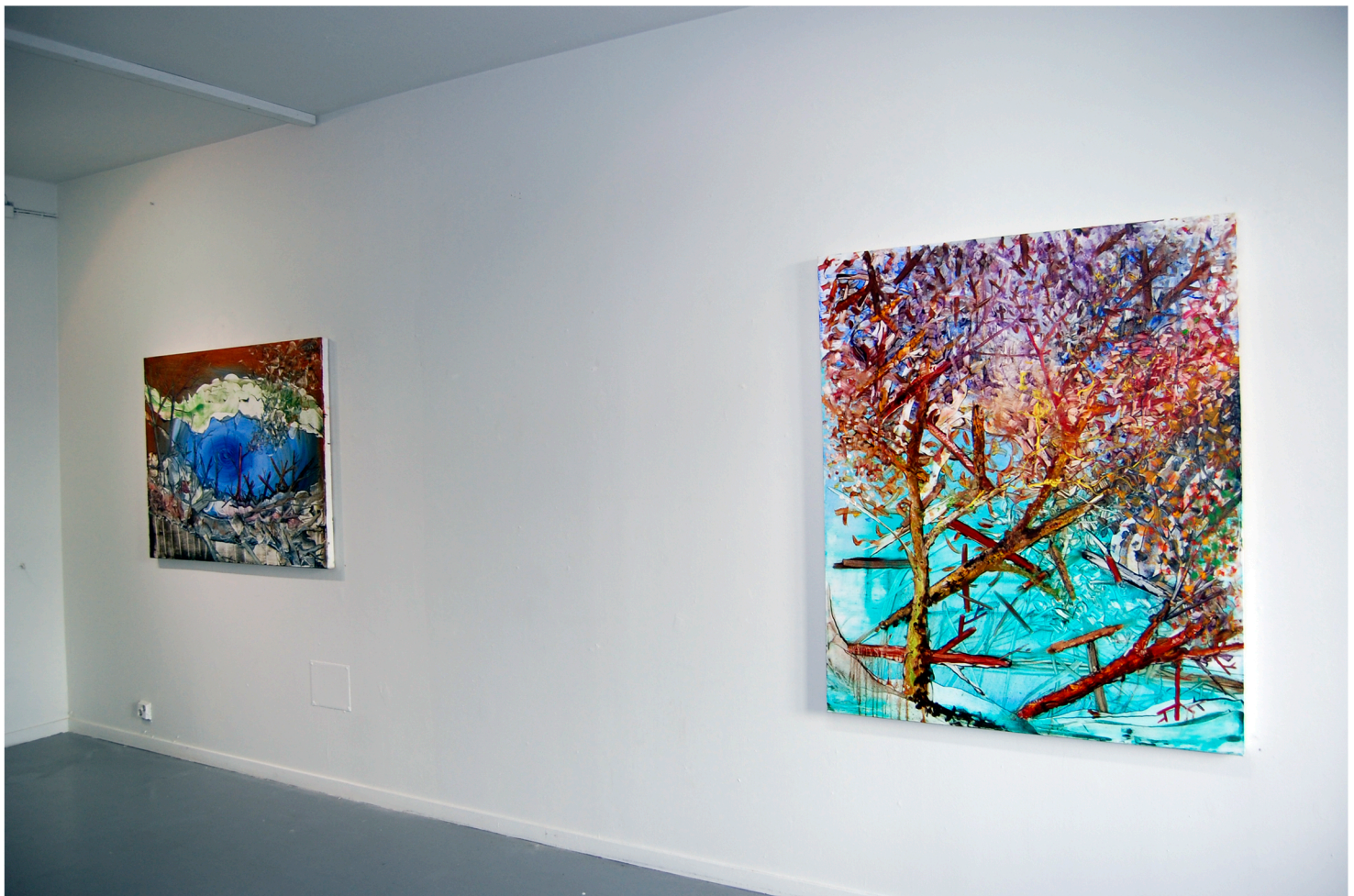
Yleiskuva näyttelystä Yksityinen ja yhteinen