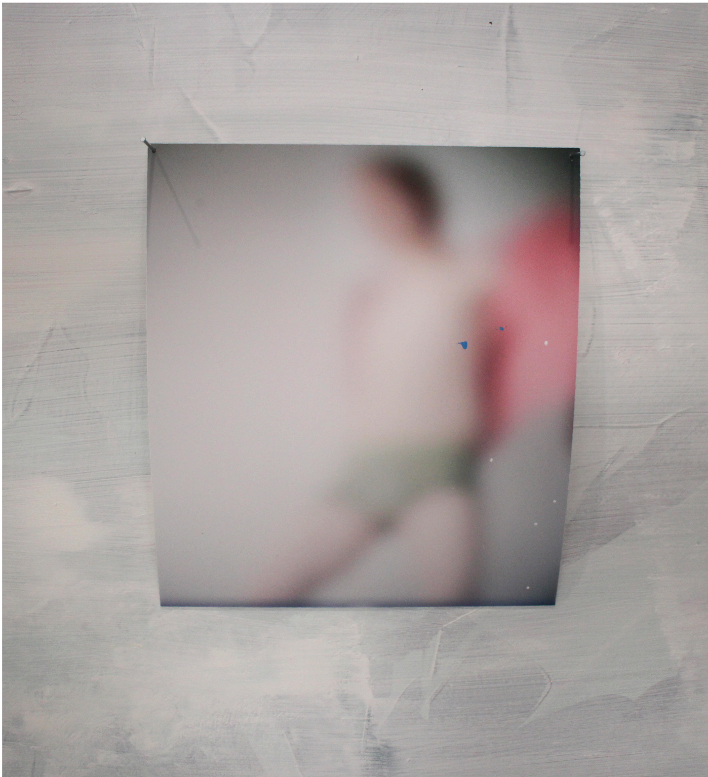
Yksityiskohta teoksesta Hurmos ja hulluus