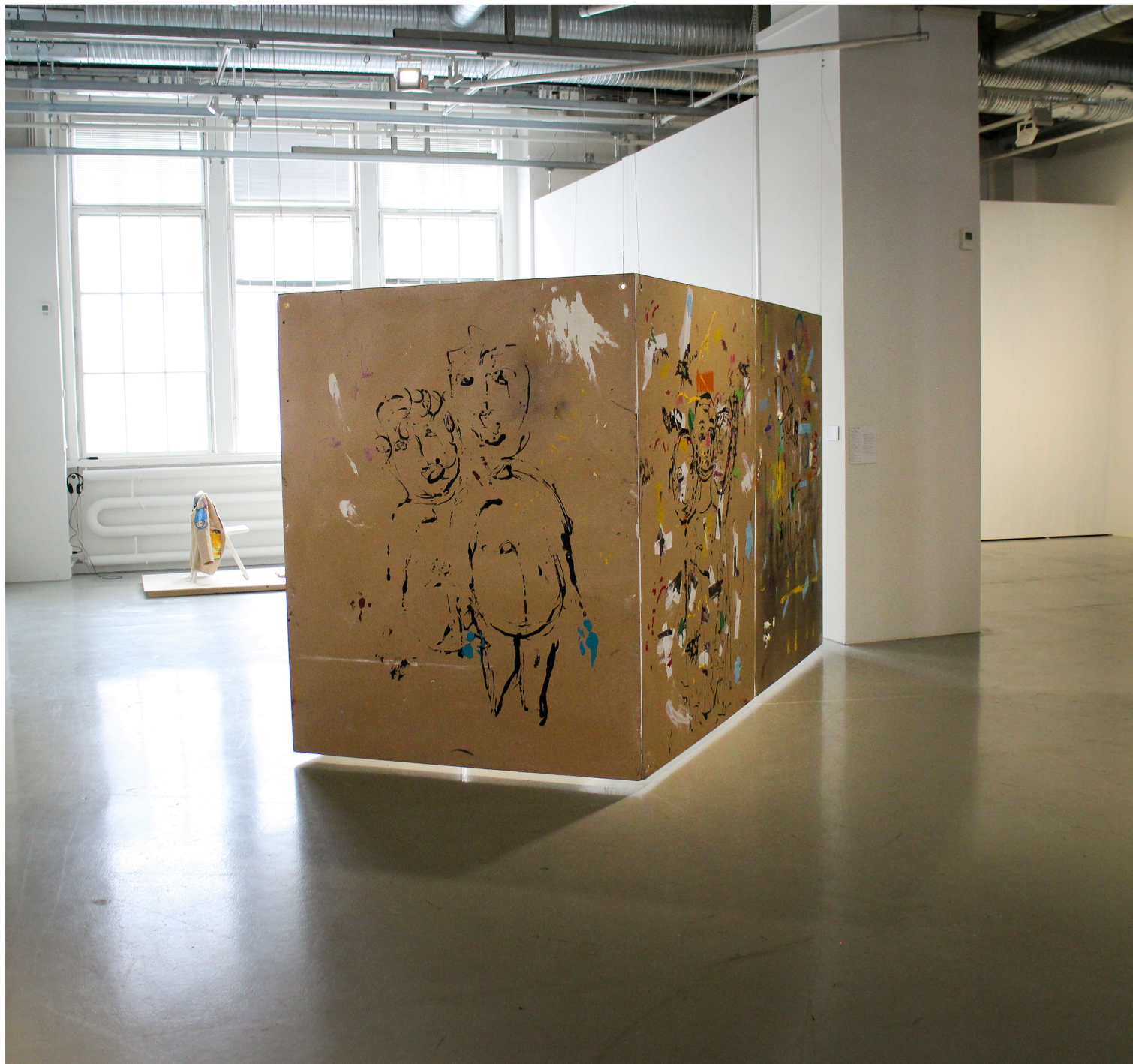
Hurmos ja hulluus akryyli, tussi, väriliitu, akryylimassa mdf - levyille, pigmenttitulosteet 320 x 200 x 160 cm

Kuvan Keväessä 2014 esillä olleissa teoksissa pohdin hurmoksen ilmiötä ja siihen liittyvää erityistä näkökykyä. Millaista on kun rakastaa ja hurmioituu jostakin?