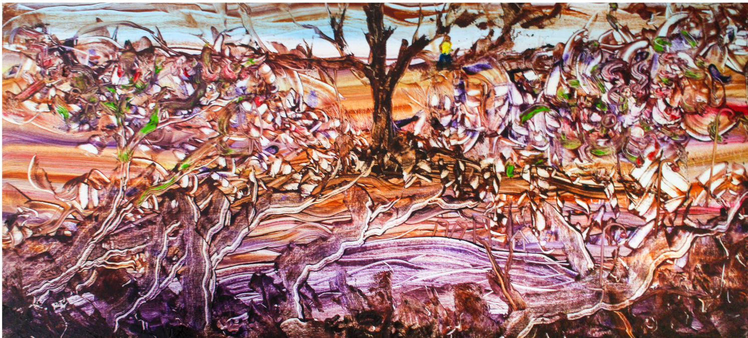
Mädäntynyt puutarha 2013 öljy kankaalle 130 x 60 cm