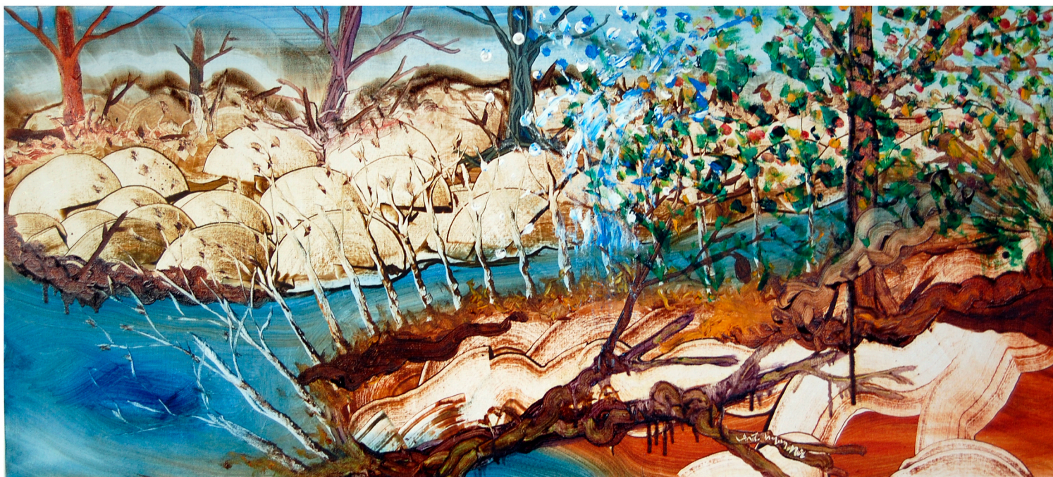
Mustapuu 2013 öljy kankaalle 130 x 60 cm