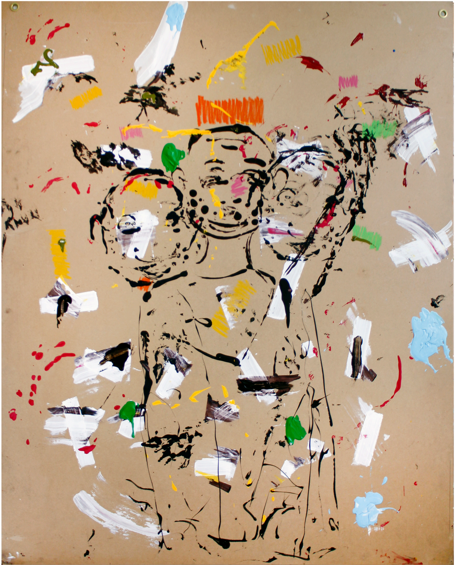
Linnut ja pojat 2014 sekatekniikka mdf – levyllä 200 x 160 cm