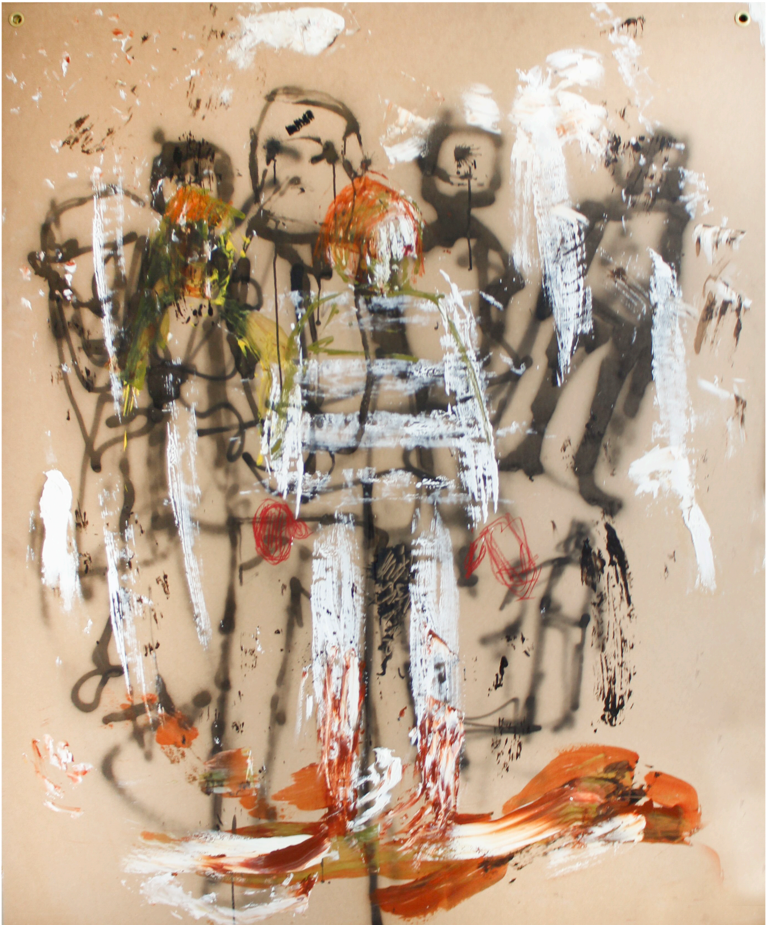
Mies ja varjot 2014 sekatekniikka mdf – levyllä 200 x 160 cm