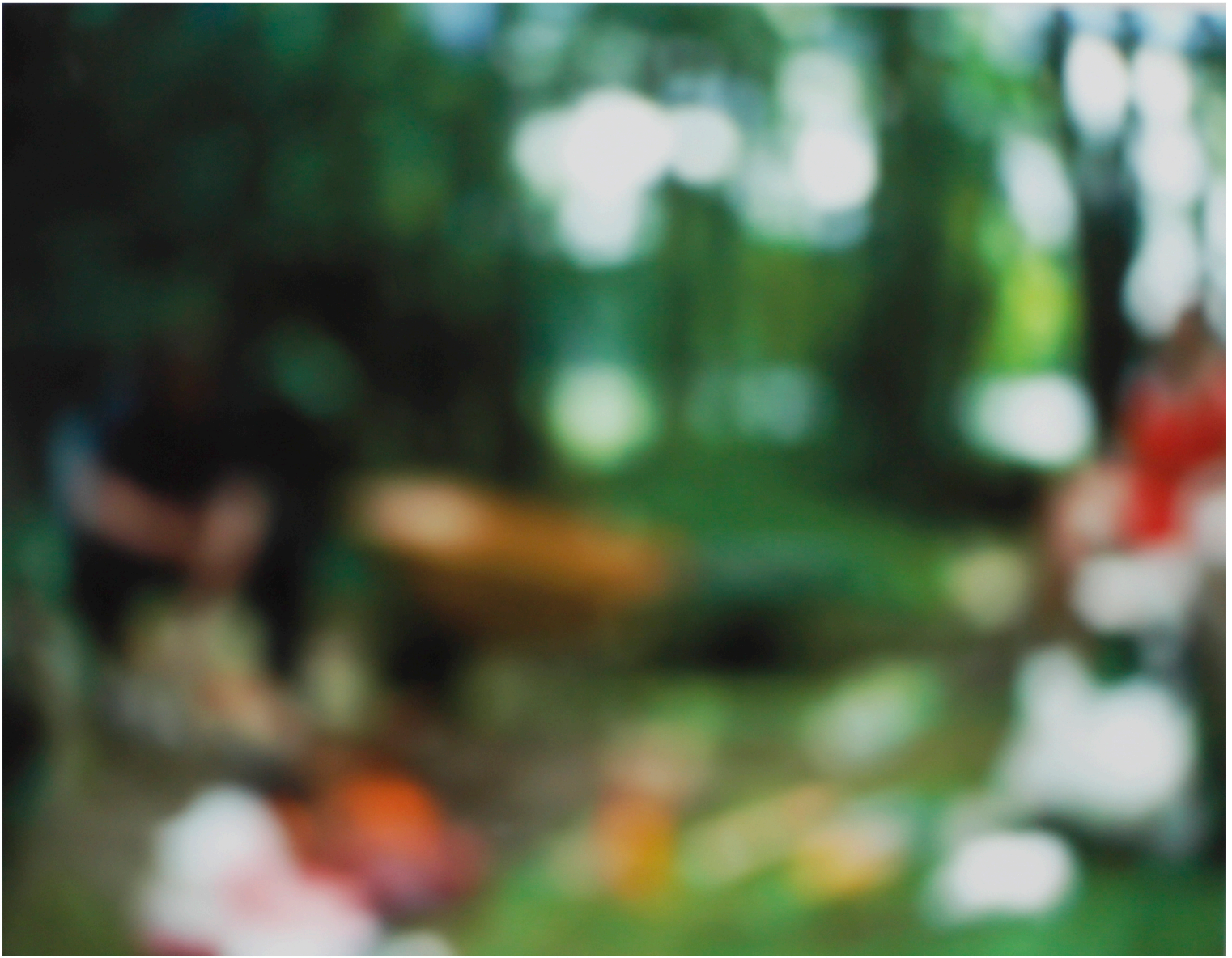
Yksityiskohta teoksesta Lauantai