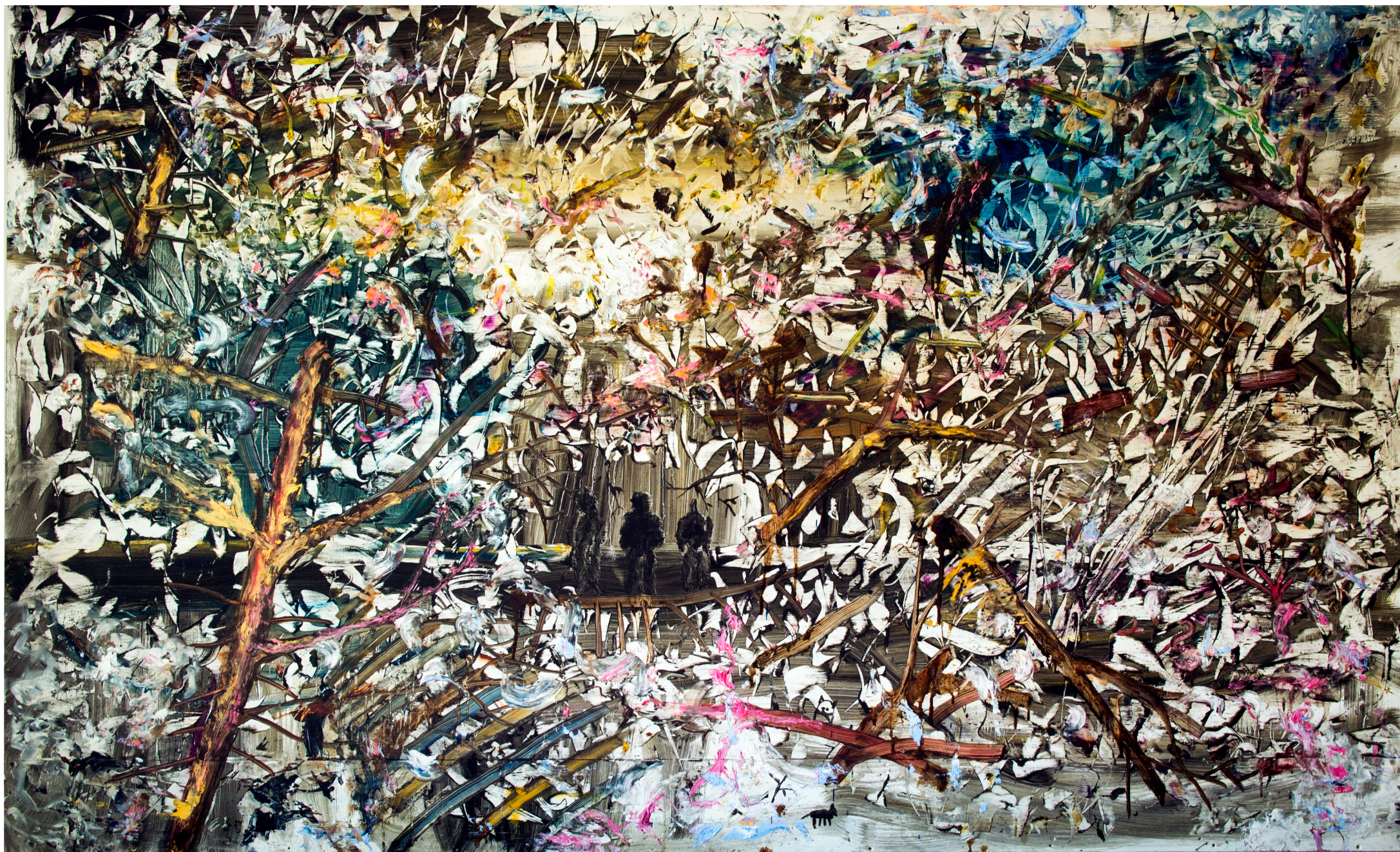
Keskellä toisen myrskyjä 2013 öljy levyllä 225 x 137 cm