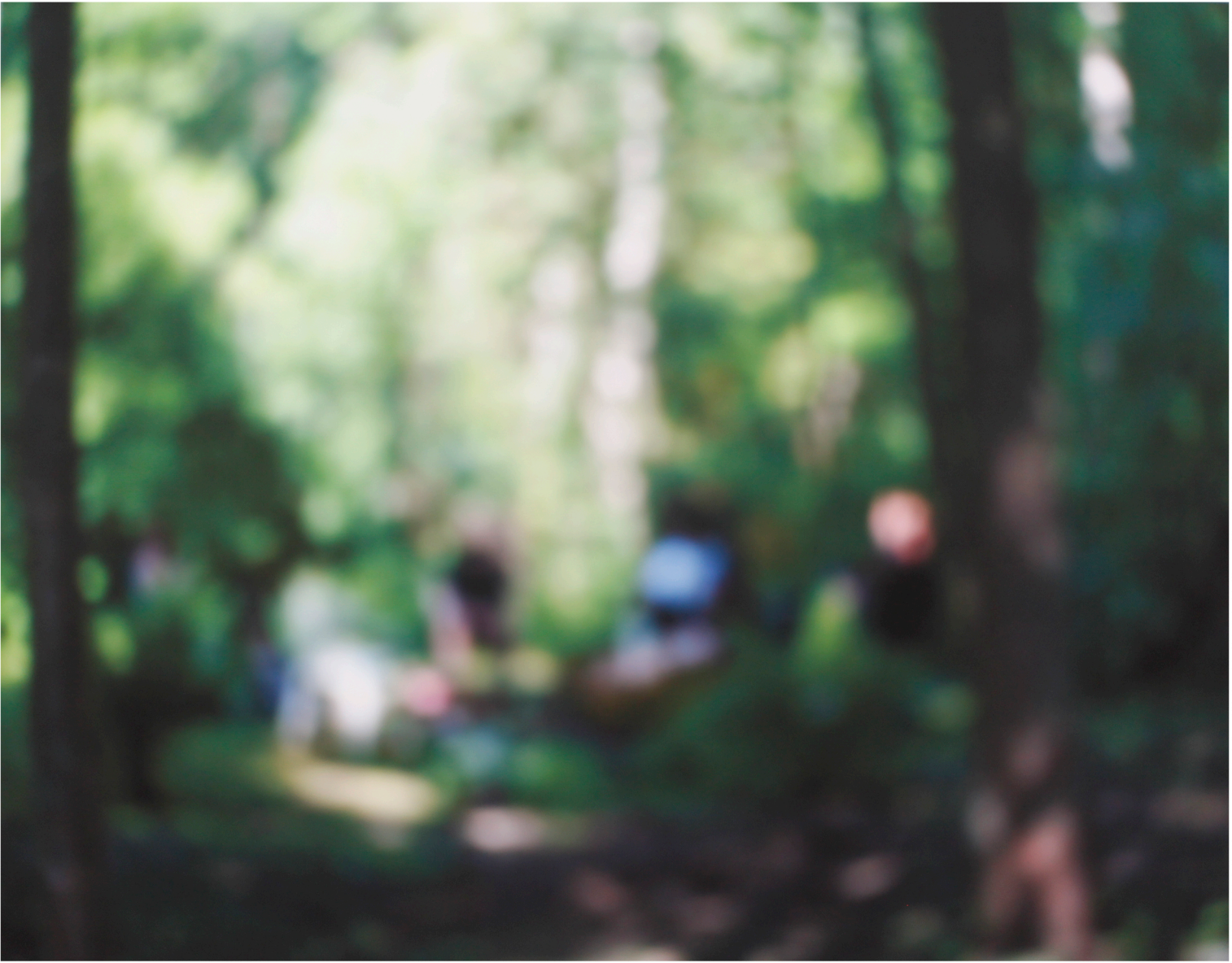
Yksityiskohta teoksesta Lauantai