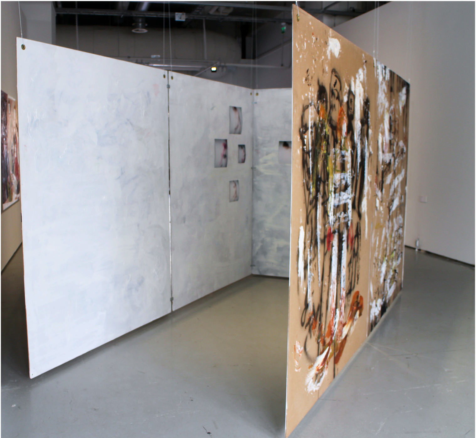
Hurmos ja hulluus