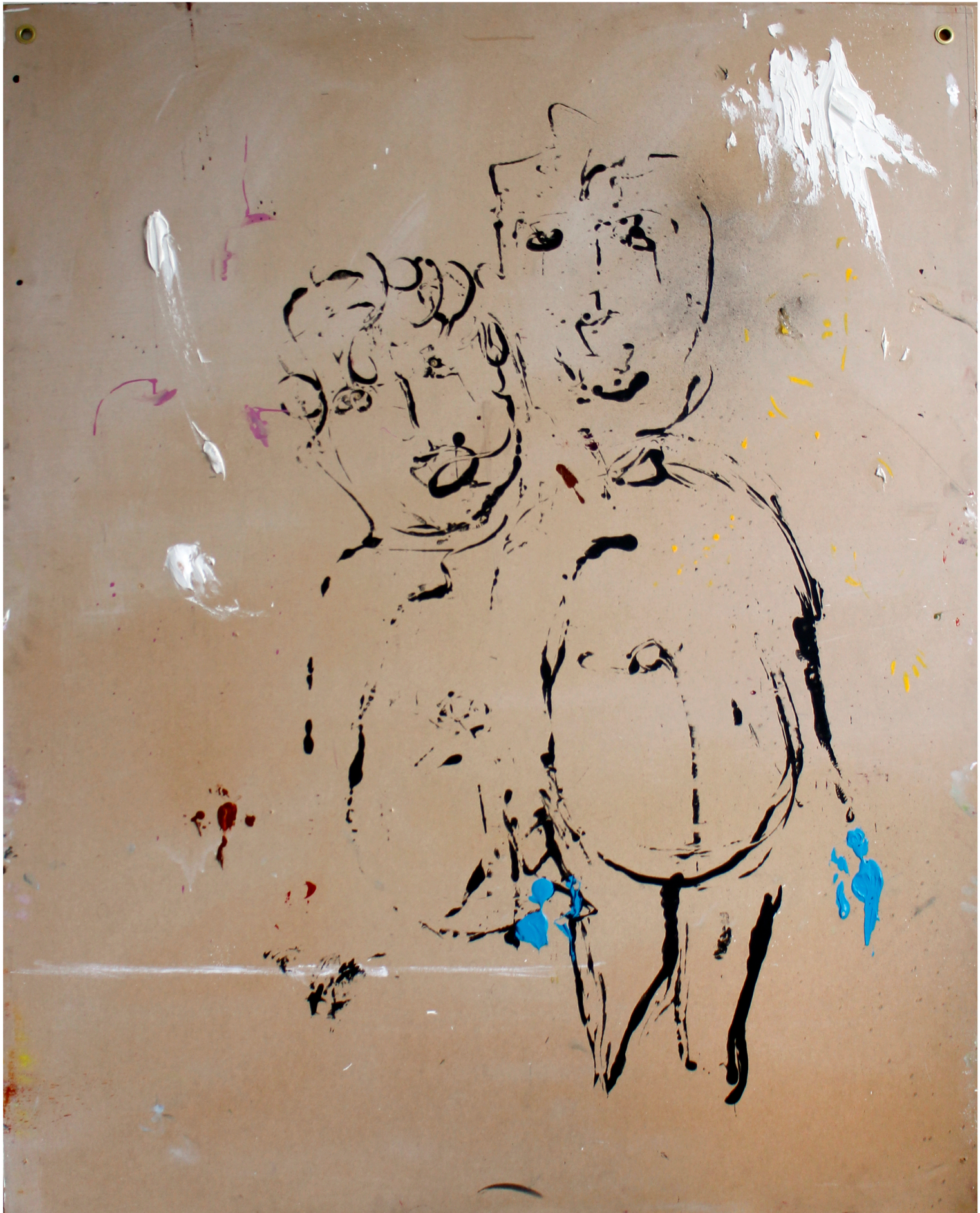
Odotusaika 2014 sekatekniikka mdf – levyllle 200 x 160 cm