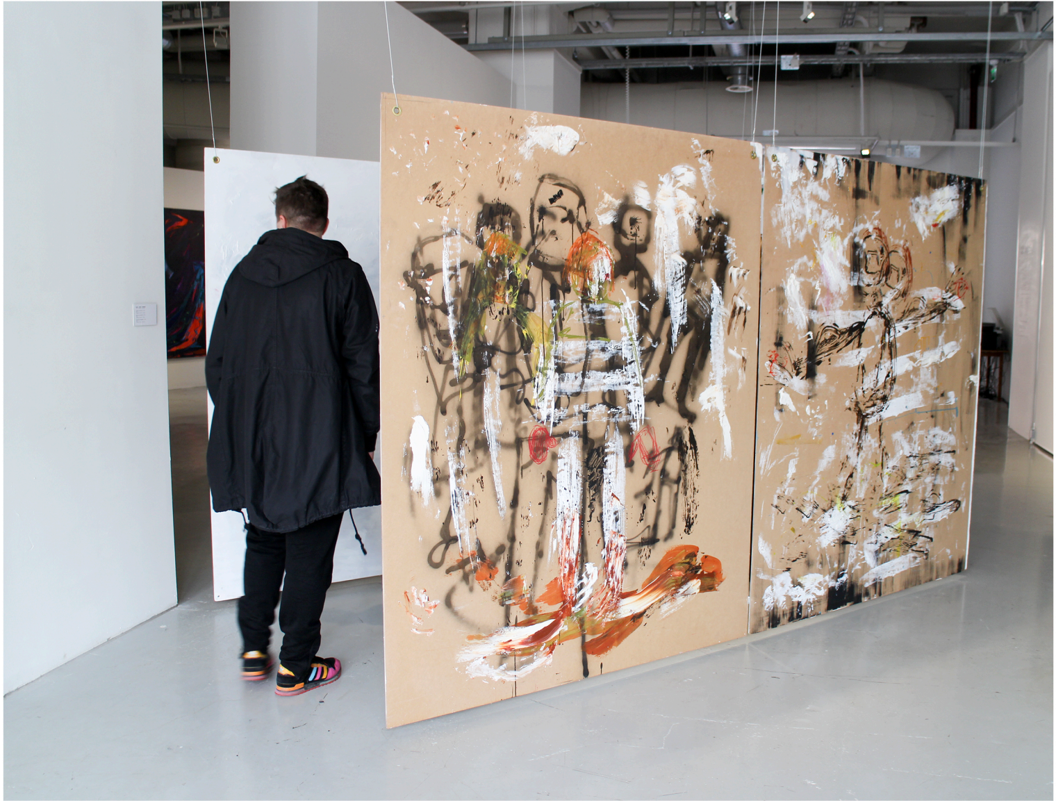
Hurmos ja hulluus