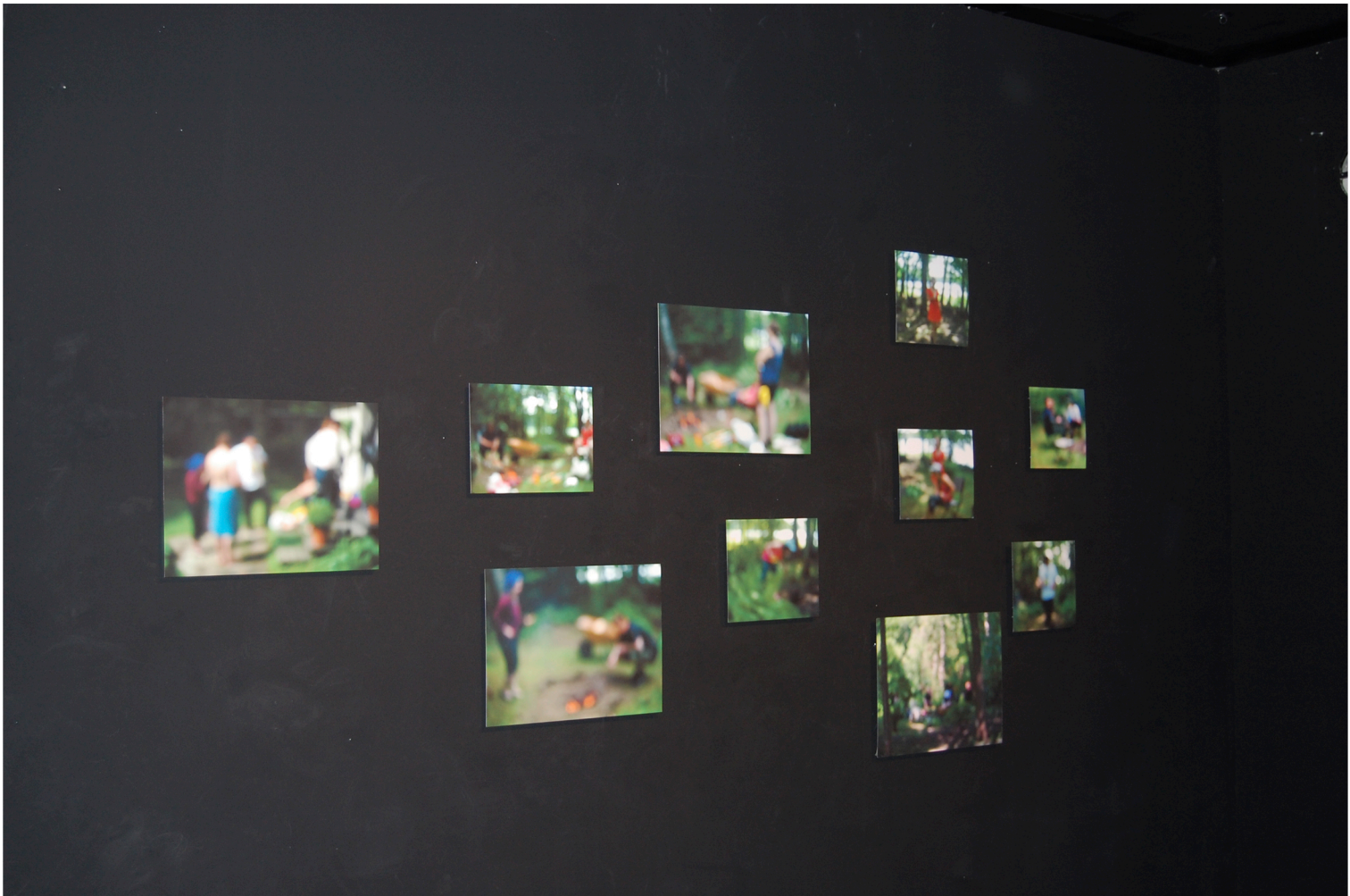
Lauantai – Teossarja 2013 pigmenttivedos paperille, pohjustettu alumiinille 10 kpl eri kokoja

Lauantai- teossarja muodostuu 10 valokuvasta, jotka on vedostettu pigmenttivedoksina ja pohjustettu alumiinille. Teoksessa nousee esiin ihanteellisista maisemakuvista poikkeava kuva. Aiheina ovat niinkin syvälliset teemat kuin mökkeily ja luonnossa oleminen. Olemme mökkeilemässä, siis ”luonnossa” ja siinä tilassa vallitsee harmonia ja yhteys, jota voi tosin olla vaikea nähdä.