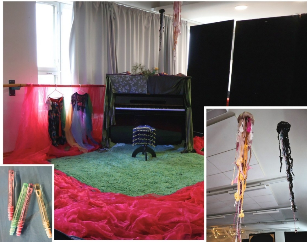
Kuva 9: Kuva teoksesta ja sen yksityiskohdista.

Näyttämöllä on esiintyjä perhoshameessa, verkkopaidassa, johon on ommeltu osia kierrätyskeskuksen tyynyliinasta ja kiinnitetty tyllihuiveja, helmistä tehdyssä päähineessä ja kimaltavissa kynsikkäissä. Lattialla lepää suuri, pörröinen, vihreänsininen lankamatto. Maton ympärille on asetettu ympyrään aniliiniväristä organzaa. Matolla on musta piano, jonka kannen päälle on levitetty vihreää kangasta, vihreää lankaa ja männyn oksia. Myös pianon jalkojen päällä risteilee pörröistä, vihreää lankaa. Katosta roikkuu puvuston ylijäämätilkuista ja muovipusseista valmistettuja meduusoja, kasvonaamioita ja muita itsen hoivaamiseen liittyviä esineitä, kesken jäänyt meduusahattu ja sen luonnokset sekä muita luonnoksia, kortti, jossa on sammalta vasten lepäävä käsi ja kortin kanssa samassa siimassa roikkumassa kortista inspiroituneita tekstejä. Yleisöllä on käsissään pieniä saippuakuplanpuhallus-settejä. Ilmassa risteilee ääniaaltoja pianosta ja saippuakuplia, joita yleisö puhaltaa.