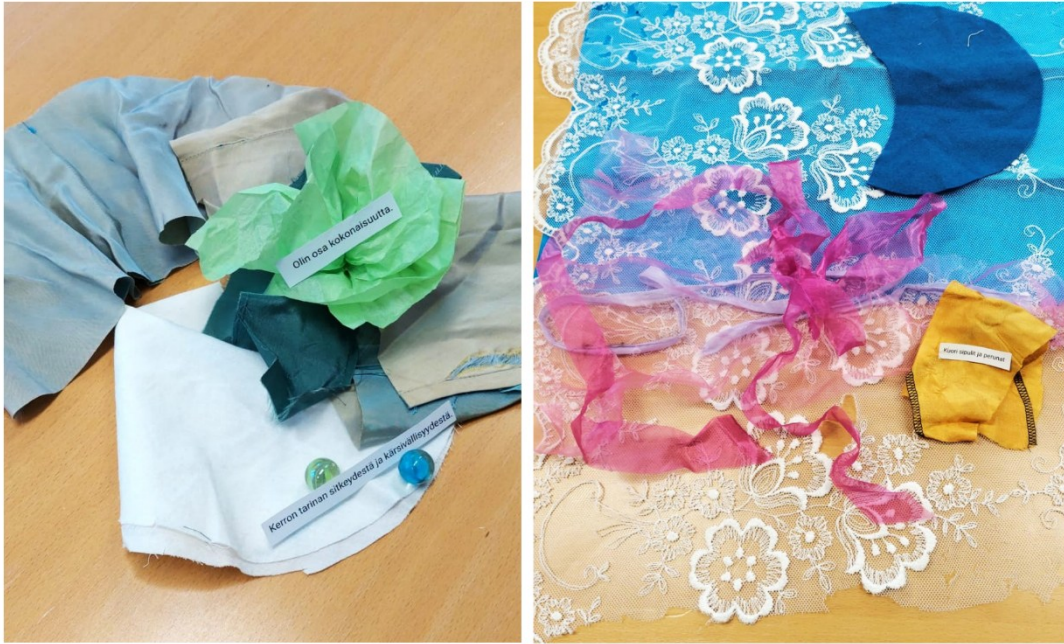
Kuva 3: Väläytysteksteillä nyrjäytettyjä maisemakollaaseja. Vas. kuvan tekstit: "Olin osa kokonaisuutta." ja "Kerron tarinan sitkeydestä ja kärsivällisyydestä." Oik. kuvan teksti: "Kuori sipulit ja perunat."