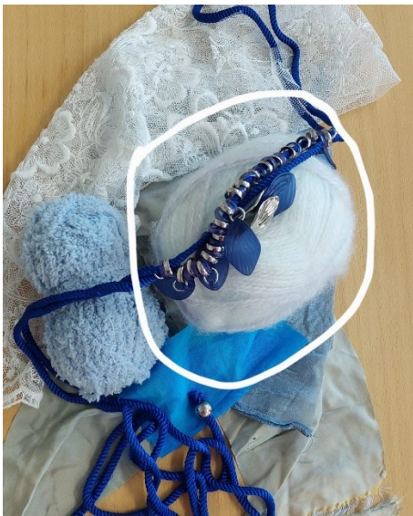
Kuva 12: Valkoisella ympyröity pörröinen lankakerä, joka toistuvasti oli yhden osallistujan hypisteltävänä. Kuva osallistujan sommitelmasta otsikolla ”Minä ja taide.”

Tässä luvussa avaan prosessissa syntyneitä itselleni merkittäviä havaintoja toiminnasta. Havainnot liittyvät sosiaalisiin rooleihin toiminnassa (myös suhteessa materiaaleihin), huumorin toisaalta kompleksiseen luonteeseen ja siihen liittyviin eettisiin pohdintoihin prosessin ohjaajana, huumoriin valittuna sisäisenä asenteena pedagogin roolissa, sekä kohtaamisen laaduista vankilaympäristössä syntyneisiin havaintoihin. Prosessin tunnelmasta ja ilmapiiristä täytyy sanoa, että ryhmässä vallitsi pääsääntöisesti iloinen ja ennen kaikkea toiminnasta innostunut ilmapiiri, ja minun silmiini vaikutti siltä, että osallistujat tulivat harjoituksiin mielellään. Materiaalit herättivät osassa ryhmää usein innostunutta hypistelyä ja osalle ryhmäläisistä valikoitui suosikki-kortteja ja suosikki-materiaaleja, kuten kortti, jossa oli kuva kissasta pyöräkorissa ja pörröinen lankarulla, jonka yksi osallistuja otti toistuvasti käsiinsä hypisteltäväksi. Lankakerän hypistelyssä näyttäytyi mielestäni materiaalien aistinen miellyttävyys.