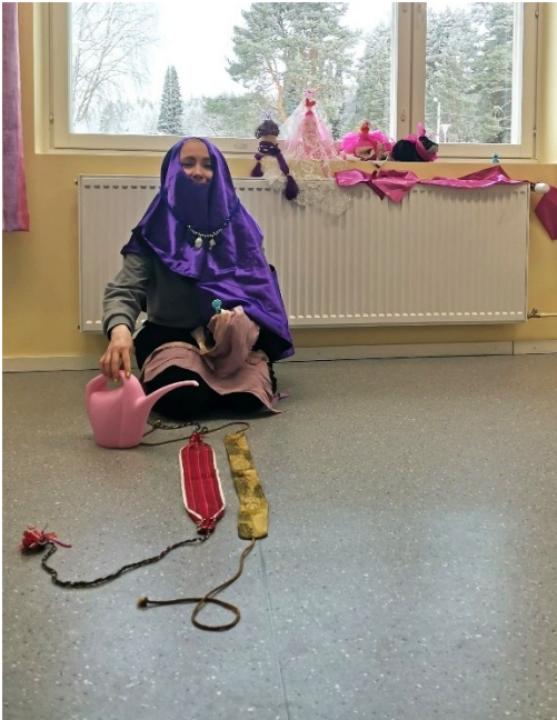
Kuva 13: Minä materiaalina sekoittuneena toisten materiaalien ja esineiden kanssa.

Oheisessa kuvassa olin itse mennyt harjoituksissa osaksi sommitelmaa ja osallistujat lisäsivät minulle asusteita ja esimerkiksi kastelukannun käteen. Tämä oli minusta ihan riemukas rooli ja se purki minusta hetkellisesti sosiaalisen roolin tilanteen ohjaajana. Kyseisessä kuvassa minä en enää ollut ihminen vaan materiaallinen objekti muiden samanlaisten joukossa. (Tämä on virkistävä harjoite, suosittelen lämpimästi kokeilemaan.) Myös osallistujista muutamat asettuivat harjoitteen yhteydessä toisinaan materiaaleiksi.