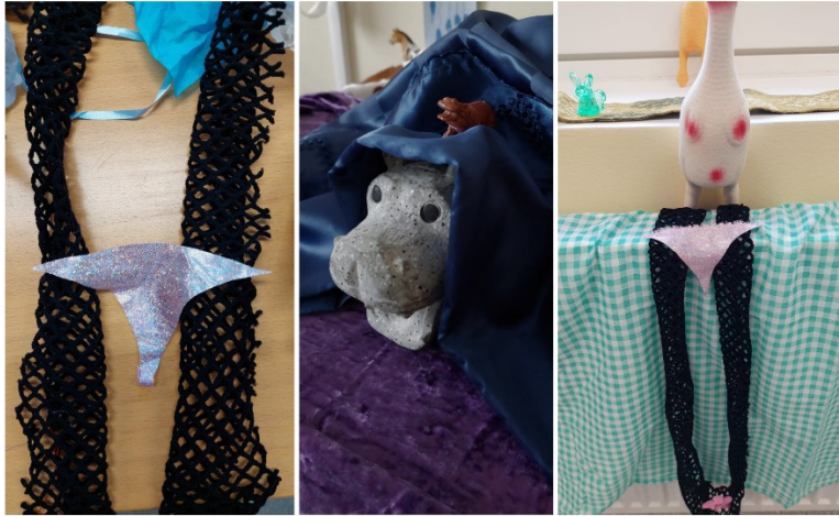
Kuva 15: Materiaaleista syntynyttä huumoria toiminnan tauolla ja kahdessa eri sommitelmassa prosessin aikana.

Materiaalin, leikin ja huumorin tutkiminen vankilakontekstissa osoittautui todella kiinnostavaksi tutkimusaiheeksi, jossa koin itsekin runsaasti jaettua iloa, leikkiä, intoa ja huumorin hetkiä. Oli kiinnostavaa, millaista intoa, iloa ja leikkiä materiaalit herättivät ja millaisiin maailmoihin pääsimme niiden kautta kurkistamaan. Olen iloinen, että vaikka pidin huumorin tutkimista vankilaympäristössä aluksi hieman jännittävänä, prosessi osoittautui kaikin puolin ja kaikille osapuolille pääsääntöisesti positiiviseksi ja ajoittain myös riemukkaaksi kokemukseksi.