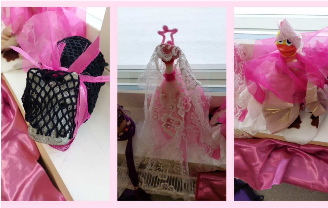
Kuva 5: Kumieläimet yhteissommitelmassa harjoituksissa (yksityiskohtia tilaan rakennetusta sommitelmasta).

eläinhahmo, ne tuottavat ääntä ja minun kokemuksessani kutsuvat koskettamaan ja kokeilemaan, millainen ääni niistä syntyy. Sosiaalisessa mediassa ovat myös 2020-luvun puolella trendanneet videot, joissa tällaisia kumieläimiä käytetään erilaisina instrumentteina. Olen itse kokenut tämän erittäin kiinnostavaksi (ja hauskaksi) ilmiöksi ja käyttänyt kumieläimiä opetusvälineinä ja taiteellisten demojen lähtökohtina työssäni viimeisen vuoden aikana.