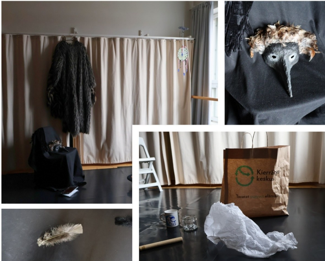
Kuva 8: Kuvia teoksesta ja materiaaleista, joilla äänimaisema tuotettiin.

Näyttämöllä on esiintyjä lintupuvussa. Yleisöllä on käsissään sulkia, joita he saavat teoksen aikana puhaltaa. Katosta roikkuu unisiepparista muotonsa lainannut veistos, jonka päällä on korpin siluetti. Esiintyjällä on käsissään nahkakantinen muistikirja ja sulkakynä ja hän istuu viltillä päällystetyn tuolin päällä. Tilaan loistaa oranssi valo, joka heittää unisiepparin varjon verhoon. Ilmassa leijuu ääniaaltoja ääniteoksesta, jonka tuotimme ryhmänä vankilassa välineinämme pöydän pinta, mukit, paperipussi, puinen rytmikapula, silkkipaperi, lasipurkki, jossa oli foliopalloja ja sormenpäät pöytää vasten. Lattialla lukemista odottaa taiteilijan kirjoittama teksti.