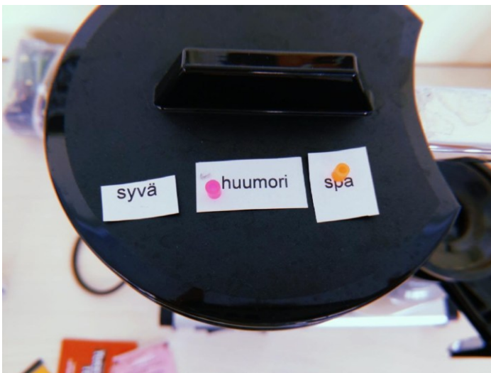
Kuva 6: Prosessista nousseita sanoja, joiden päällä äänestyskelmiä myös muille tärkeiden sanojen päällä.