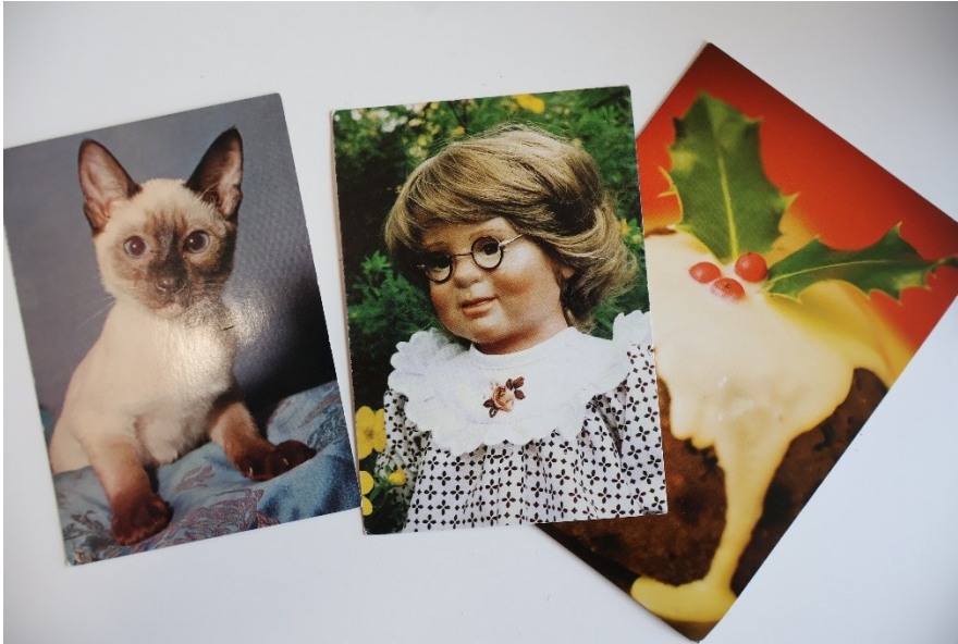
Kuva 14: (Vasemmalta oikealle): Kissa-kortti, Paha Pedagogi-kortti ja Torttu-kortti, joiden suojista oli keveämpää pitää huolta aikatauluissa pysymisestä.

tai ”Paha pedagogi sanoo tähän, että voimme kysyä savukonetta lainaan, mutta katsotaan voiko sitä käyttää kuinka myöhään illalla.”