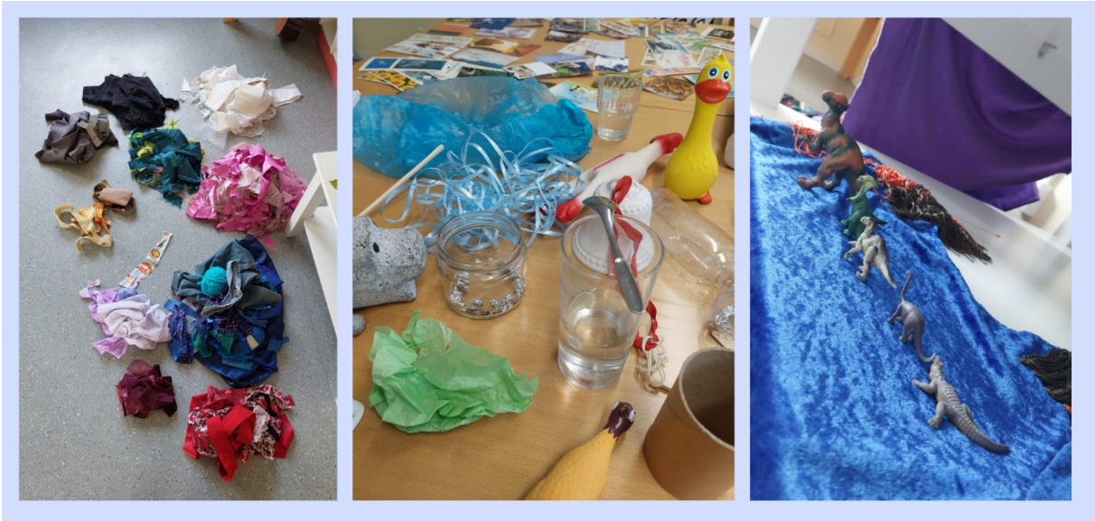
Kuva 1: Erilaisia materiaaleja eri tilanteissa pitkin harjoituskautta.

Käyn tässä luvussa läpi tutkimukseni otetta, työn taustalla vaikuttavaa uusmaterialistista ajattelua, avaan omaa suhdettani materiaaleihin taiteilijana ja pedagogina ja kuvailen työn tapahtumaympäristöä eli vankilaa.