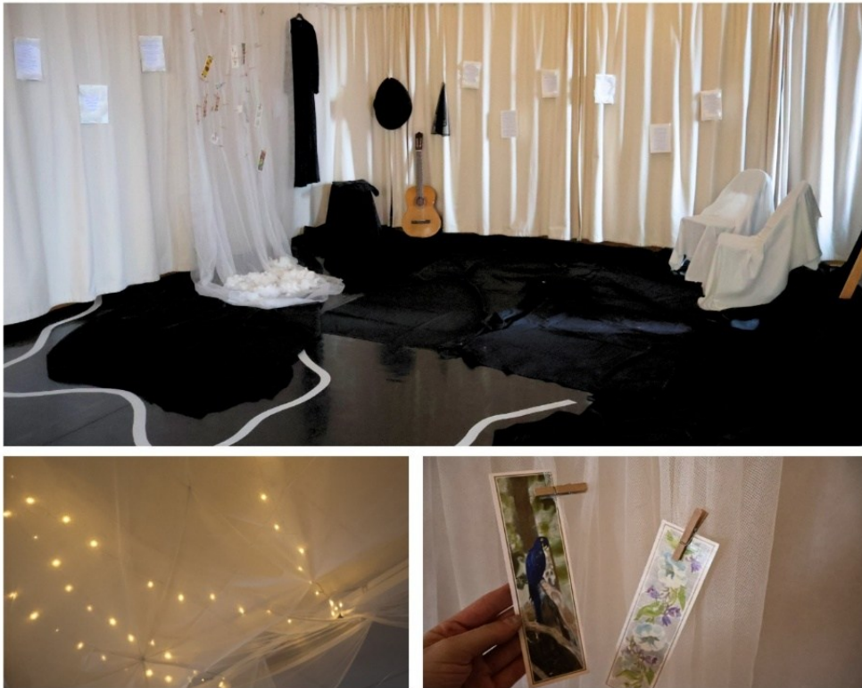
Kuva 7: Kuvia teoksesta ja sen yksityiskohdista.

Näyttämöllä on esiintyjä mustassa iltapuvussa, suuressa mustassa lierihatussa ja harso kasvoillaan. Esiintyjän käsissä on kitara. Yleisöllä on kierrätyskeskuksesta löytyneet ja esiintyjän niiden seasta valitsevat pakettikortit sekä kynät. Seinälle on ripustettu harsoa, jossa on valmiina odottamassa pyykkipoikia yleisön täyttämiä kortteja varten. Kattoon on ripustettu paljon valkoista harsoa, tamponeista purettua pumpulia ja lämpimänsävyiset kausivalot. Lattialla ja näyttämöalueen reunoilla on mustaa kangasta ja mustia lattiatyynyjä. Ilmassa väreilee ääniaaltoja esiintyjän kitarasta, äänestä ja nauhoitetusta ja miksatusta ääniteoksesta. Seinän vierellä on roikkumassa taiteilijan uskosta ja hänen koirastaan kertovia runoja.