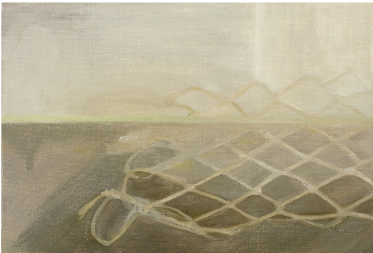
Fiskenät , 2015. Olja på duk, 37x55 cm.