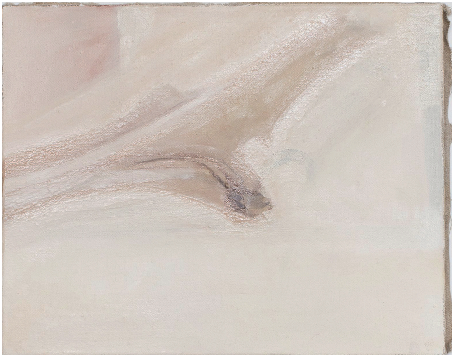
Bone (Suomenlinna), 2015. Olja på duk, 33x41 cm.