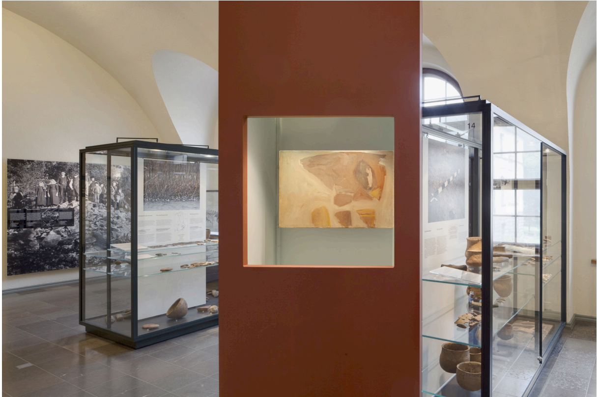
Keramik placerad i område med keramik från olika tidsperioder.