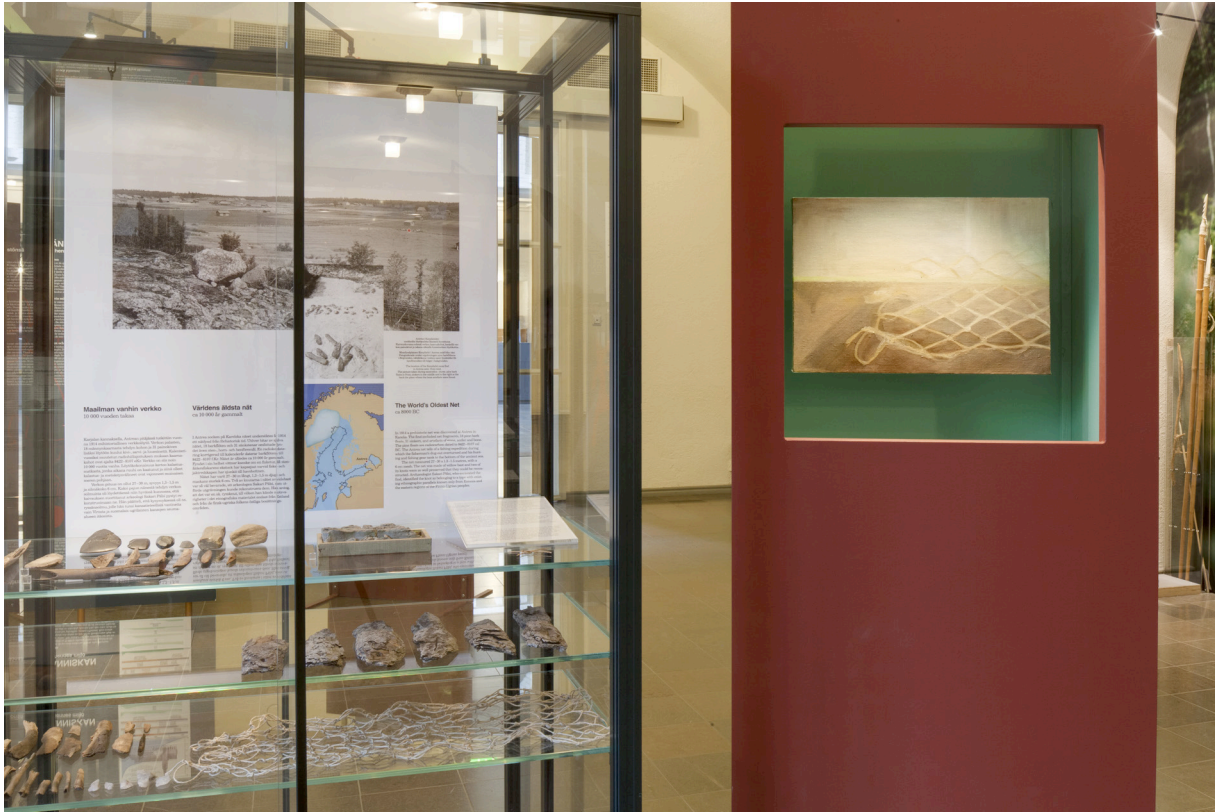
Fiskenät vid 10 000 år gammalt fiskenät och fiskeredskap, Karelska näset.