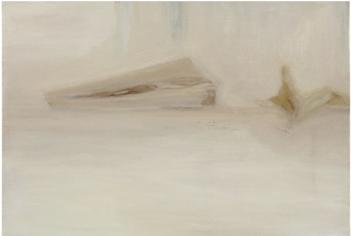
Broken bone (Suomenlinna) , 2015. Olja på duk, 37x55cm.