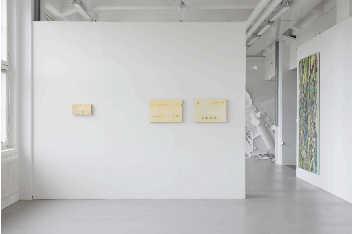
Coins (National Museum) I , 2015, olja på duk, 18x33 cm. Coins (National Museum) II , 2015, olja på duk, 37x55 cm. Coins (National Museum) III , 2015, olja på duk, 37x55 cm.