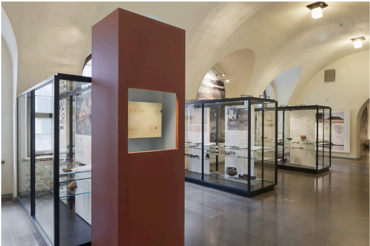
Mynt placerad i område med olika slags förmål från Järnåldern.