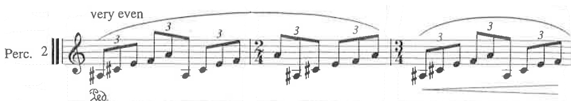
Nuottiesimerkki 16. Alitajuinen mysteeriaihe vibrafonilla viidennen osan tahdeissa 29–31 (Saariaho 2002, 92).

mutta epäsäännöllisesti myöskin solistin laulaessa. Mielestäni sille on syynsä: se on toisaalta äidin mielenmaiseman sisällä mutta myös äidin ulkopuolinen, itsenäinen tuntematon.