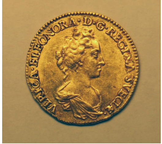
Kuva 5. Ulrika Eleonoran 2 dukaattia vuodelta 1719 Burmanin haaksirikosta.

Luodon haaksirikkojen 1720-luvun pelastusluetteloissa painottuvat rahat, joita esiintyy myös löytöaineistossa runsaasti. Rahat ovat tärkein löytöryhmä haaksirikkopaikkojen ajoituksen kannalta (kuva 5). Köbergsgrundenin haaksirikon isovihan jälkeiselle ajoitukselle loivat pohjan 1978 koululaisten tekemät rahalöydöt. Luodosta löytyi rahoja kuitenkin jo 1800-luvulla. Vuonna 1894 haaksirikkoalueilla liikkui merenkulkijoita Luodon Bysundetista, jolloin kalastajat löysivät Koppargundetista kuusi neljän taalarin ploodua vuodelta 1721. 19 Sieltä miehet siirtyivät noin kolmen kilometrin päässä etelän suunnalla sijaitsevalle ”Kybergsgrundetille” ” där äfwen ett fartyg säges hafva gått under ”. Sieltä retkikunta onnistui saamaan talteen rahoja vuosilta 1713, 1718, 1719 ja 1721. Rahojen yhteispaino ylty 14,5 kilo-