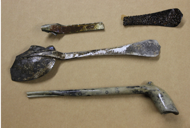
Kuva 6. Vuoden 2011 löytöjä Burmanin haaksirikosta.

tista 1894–2013 löydetyistä rahoista on hopeisia. Mahdollisesti vuoden 1723 pelastustöissä on tarkoituksellisesti keskitytty hopearahoihin tai sitten pienemmät myntit ovat vain sujahtaneet pelastajien omiin taskuihin. Köbergsgrunderin rahalöydöistä 1979–86 suurin osa on hopeaa.