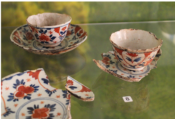
Kuva 8. Fajanssia todennäköisimmin Köbergsgrundenista.

tävän paitsi valkoista, sinistä ja punaista, myös vihreää ja ruskeaa väriä. Sävyjen ja siveltimejäljen hän katsoo viittaavan Ruotsin Pomeriin, ehkä Stralsundiin. Lautanen on kookkaampi