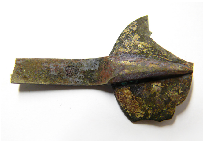
Kuva 7. Rotanhäntälusikka Burmanin haaksirikosta.

muodon osalta pääkallomaiseksi tai kolmilehdeksi. Kuvio tuo mieleen valtakunnanvaakunan kissantassun, mutta riksvapnet tulee käyttöön hopeiden kontrollileimana vasta 1754. 50 Koska rotanhäntälusikoita valmistettiin isovihan jälkeisenä aikana enää vain