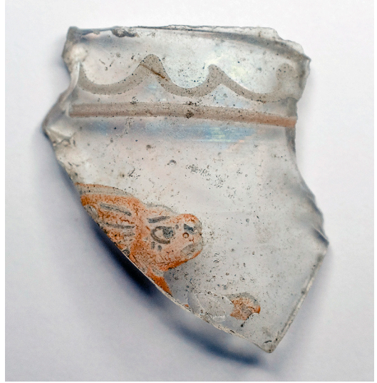
Kuva 9. Yksityiskohta emaloidusta juomalasista Kuhlbergin haaksirikosta.

Koppargrundetin massiivisin löytöryhmä ovat kattotiilet. Kyseessä ovat mitä ilmeisimmin tiilet, jotka torniolaiset olivat Tukholmasta hankkineet uuden raatihuoneen rakentamista varten ja joita syksyllä vuonna 1722 oltiin kuljettamassa Tornioon ”kaupunkilaisten omalla aluksella”. 86 Tiilimurskaa sijaitsee karikon korkeimmassa kohdassa, missä torniolaiset nähtävästi kohetasivat haaksirikkonsa. Karikko oli 1720-luvun alussa nimensä mukaisesti uusi kari, Nygrundet, laaja vedenalainen somerikko, joka maannouseman myötä oli nopeasti