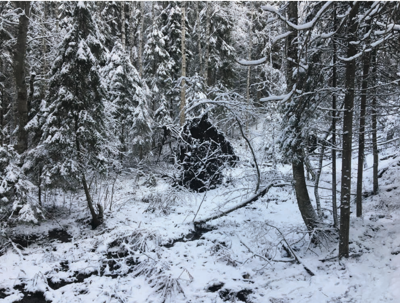
Kylmälähteen ympäristöä.