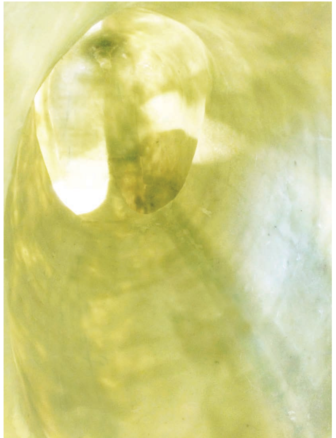
Kuvattu teoksen sisältä työhuoneella.

Kuvassa näkyy teoksen Horse Poem sisällä oleva ontto tila.