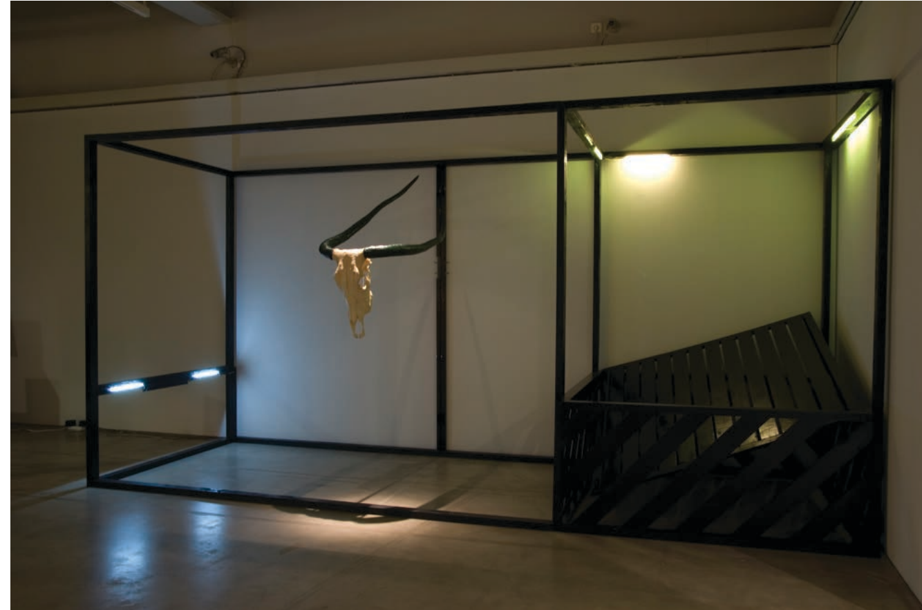
Hanna Marno, 2008. Yours forever coyote / kuviteltu lapsuuteni Kiinassa .