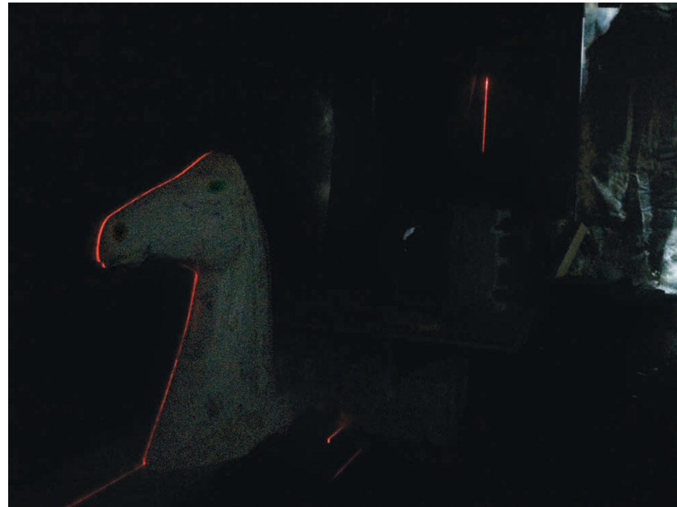
Kuva: Hanna Marno, 2017.

Kuva muotin esivalmistelusta. Kyseessä on laminointimuottitekniikka, jossa kopioitava kappale halkaistaan. Linja piirretään suoraksi laserin avulla. Kuva Tommi Stigell'in lasikuitutehtaalta, jossa sain työskennellä.