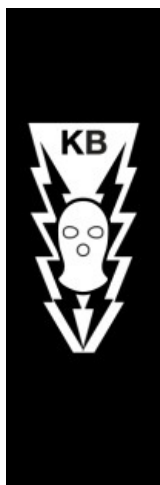
Kuva 2.1: Kommandobiisi aka Space Invaders logo