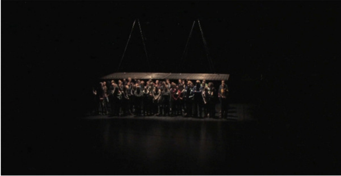
Kuva 1.2: Yleisö häkin alla.

Tilankäytössä korostuivat tilan syvyyden hyödyntäminen, tilan eri tasot, sekä mahdollisuus toimia eri puolilla yleisöä. Yleisön sijoittaminen taskuun esityksen maailman keskelle mahdollisti simultaanisten kohtausten tapahtumisen eri puolilla yleisöä ja myöskin yleisön ympäröimisen. Kuvassa 1.2 esitetään yleisölle varattu tila teoksessa ZOOaside.