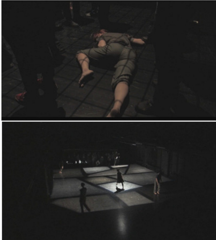
Kuva 1.3: Häkin luomat varjot yleisötilassa ja valosuunnittelulla luotu kuosi esitystilän lattiassa.

Kuvassa 1.3 nähdään valosuunnittelulla luotu häkin varjojen kuvio yleisössä ja 'eläinkuosi' lattiassa.