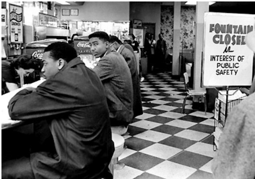
Kuva 3.1: Sit-in -protesti. Nashville 1960.

Kuvassa 3.1 nähdään Sit-in -protesti Nahsvillessä. Mustille opiskelijoille tarjoilun sijaan liike tekee päätöksen sulkea lounastiskinsä “yleisen turvallisuuden takia”.