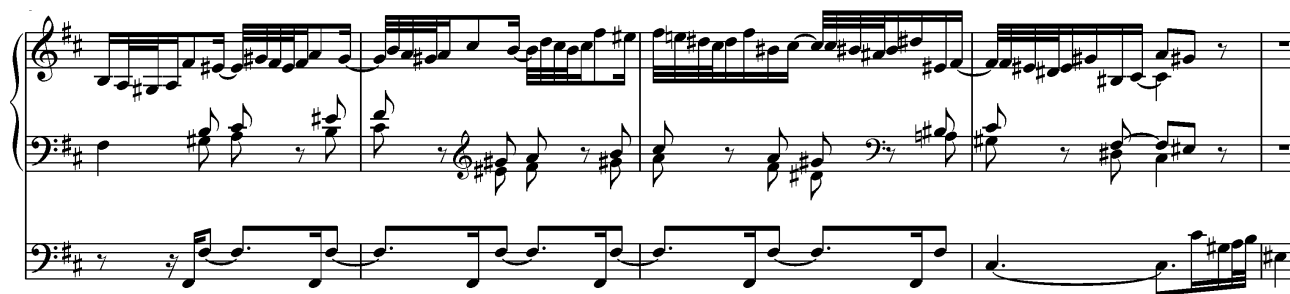
Kuva 6: Johann Sebastian Bach: Preludi h-molli, BWV 544, tahdit 30-34

Esimerkiksi Bachin h-mollipreludissa on useampia taitteita, jotka ovat lähes identtisiä toistensa kanssa. Taitteet eroavat toisistaan ainoastaan sävellajeiltaan. Kuvissa 5 ja 6 on kaksi melko kaukana toisistaan olevaa kohtaa, jotka ovat muuten lähes identtiset, mutta ensimmäisen kerran taite tulee h-mollissa ja seuraavan kerran kvarttia alemmaa fis-mollissa. Nämä kohdat ovat mielestäni tekstuuriltaan sellaisia, että niiden samankaltaisuuden huomaa nopeasti. Esimerkiksi jalkion oktaavihypyt kuvissa 5 ja 6 ovat joka kerta samassa rytmissä. Jalkios-temma on myös täysin erityyppinen kuin muu jalkiotekstuuri, joten sen huomaa helposti kappaletta analysoidessa.