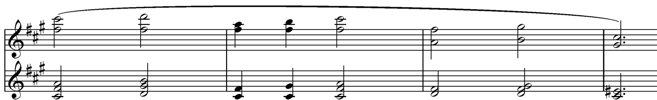
Kuva 11: Charles-Marie Widor: Urkusinfonia nro 6: I Allegro, tahdit 162-165, pelkistetty sormiosatsi

Teoksen pelkistäminen ei ole mikään uusi ilmiö. Esimerkiksi monille tuttu laulukokoelma Suuri toivelaulukirja on aina julkaissut helponnettuja sovituksia. Joissain tapauksissa pelkistäminen on niin voimakasta, että teoksen kokonaiskuva muuttuu melko paljon alkuperäiseen sävelkudokseen nähden. Pelkistämässä tulisikin löytää kultainen keskitie siihen, miten paljon teosta voi muokata muuttamatta kappaleen kuulokuvaa liian radikaalisti.