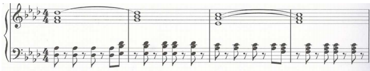
Kuva 15: Coldplay: Viva La Vida , tahdit 1-4

Klassisesta musiikista rytmisen pelkistämisen esimerkki on jo aiemmin mainittu J. S. Bachin urkukoraali In dulci jubilo (kuva 3). Siinä on väliäänissä tasainen neljäsosakulku, joka muodostaa polyrytmiikkaa melodiassa olevien triolien kanssa. Koska neljäsosaliike on koko ajan vain väliäänissä, voi soittamisen helpottamiseksi harkita, että neljäsosat muutettaisiin puolinuoteiksi (kuvan 14 tahdeissa 3 ja 4 olevat väliäänit). Kuvan 8 esimerkki Franckin amollikoraalista on myös rytmien pelkistämistä: karsitaanhan siinä nopeimmat rytmit pois ja muokataan ne hitaammiksi rytmeiksi.