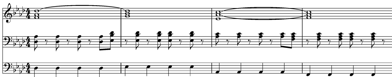
Kuva 16: Coldplay: Viva La Vida , tahdit 1-4, muokattu versio, jossa jalkio mukana soittamassa neljäsosia

Populäärimusiikin maailmasta hyvä esimerkki rytmien pelkistämisestä on Coldplay -yhtyeen kappale Viva La Vida , jota myös jonkin verran toivotaan häämarssiksi. Kuvan 15 esimerkistä huomaa kappaleelle tyypillisen rytmikuvion (tahdit 1-2). Sitä ei itsessään kannata karsia pois, sillä se on hyvin olennainen osa kappaletta. Tätä rytmiä ei kuitenkaan ole mitään mieltä soittaa sekä säestävällä kädellä että jalkiolla. Mielestäni tässä tapauksessa olisi järkevintä ottaa jalkioon bassorummun soittamat tasaiset neljäsosat: ne pitävät hyvin synkooppirytmien kanssa eikä teoksen lopullinen kuulokuva muutu juurikaan, sillä bassorumpu soittaa alkuperäisesäkin kappaleessa neljäsosia lähes koko ajan (kuva 16). Populäärimusiikin sovittamisessa uruille ei siis mielestäni kannata tavoitella tähtiä taivaalta ja yrittää toteuttaa rytmisiä elementtejä liian monimutkaisesti. Onhan aivan eri asia soittaa yhdellä instrumentilla se, mitä kokonainen bändi soittaa. On otettava huomioon myös akustiset olosuhteet: kirkkotila on yleensä niin kaikuisa, etteivät kovin nopeat rytmit taukoineen välttämättä erotu hyvin kaiun takia.