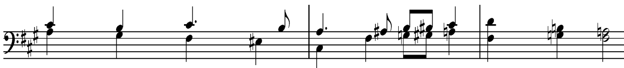
Kuva 8: César Franck: Koraali a-molli, tahdit 98-100, pelkistetty vasemman käden stemma

Nopeasti kappaletta omaksuttaessa ei kaikkia nuotteja yleensä kannata edes yrittää soittaa. Hyvä keino pelkistää harjoiteltavaa teosta on jättää stemmoja kokonaan soittamatta. Tämä toimii erityisesti oktaavikaksinnetuissa stemmoissa. On kuitenkin hyvä muistaa, että pelkistäminen kannattaa useimmiten kohdistaa väliäänini: mikäli ylin stemma on kaksinnettu oktaavia alemmalla stemmalla, voidaan pelkistäessä jättää soittamatta juuri tuo alempi stemma, sillä se ei erotu yhtä hyvin kuin kaikista korkein stemma. Oktaaveissa soittamista pystyy helpottamaan muillakin keinoilla. Esimerkiksi jos teoksessa on yksiäänistä tekstuuria oktaaveissa, voi ylemmän stemman korvata rekisteröimällä 8'-äänikerran kanssa 4'-äänikerran. Tai vastaavasti voi alemman stemman korvata rekisteröimällä 8'-äänikerran kanssa 16'-äänikerran. Aina tällainen rekisteröintikeino ei ole kuitenkaan mahdollinen kappaleen karakterin takia.