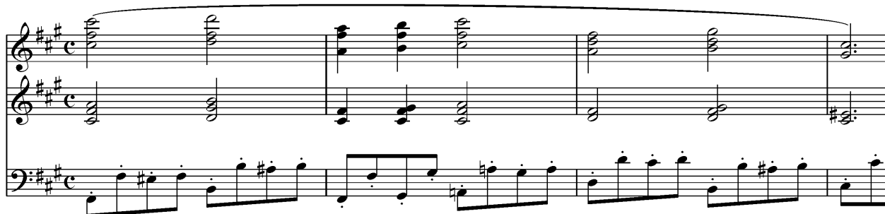
Kuva 10: Charles-Marie Widor: Urkusinfonia nro 6: I Allegro, tahdit 162-165

Mikäli teoksessa on paljon sointuja, voi tarkastella, tarvitseeko jokaista sointuun kuuluvaa säveltä soittaa. Usein soinnuissa on esimerkiksi kaksinnettu joko soinnun perussävel tai kvintti. Näitä kaksinnuksia ei välttämättä tarvitse soittaa. Mikäli sointu on sijoittuu oikeaan käteen niin, että soinnun ylimmässä sävelessä on melodia, ei tähän säveleen kannata kajota vaan mieluummin poistaa soinnusta säveliä alhaalta päin. Soittoteknisesti on myös helpompaa soittaa sointuja, jos niissä on vähemmän säveliä. Erityisesti pienikätisillä soittajilla isojen sointujen soittaminen on teknisesti haastavaa sormien ulottuvuuden takia.