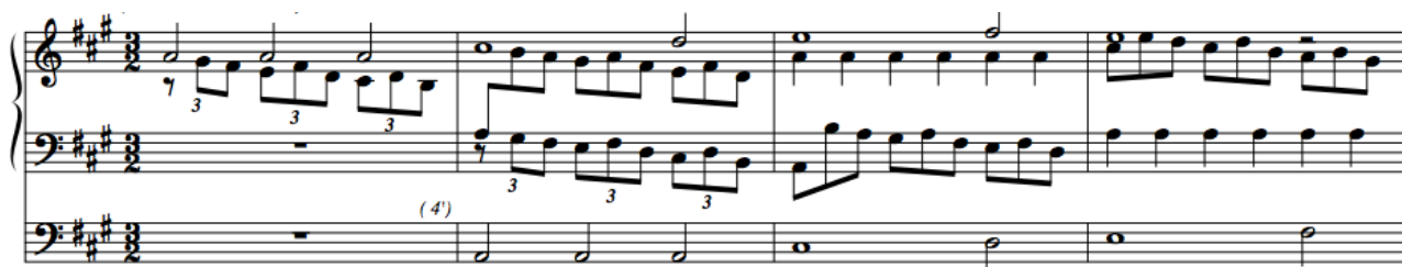
Kuva 3: Johann Sebastian Bach: In dulci júbilo BWV 608, tahdit 1-4

Myös polyrytmiikka nivoutuu osaltaan yhteen kappaleiden hankalien kohtien kanssa. Mielestäni on tärkeää analysoida erikseen ne kohdat, joissa on paljon rytmistä vaihtelua tai polyrytmiikkaa eri stemmojen välillä. Tästä esimerkkinä on kuva 2: jokainen stemma soittaa omaa rytmistä kuviotaan. Toisenlainen esimerkki polyrytmiikasta on Johann Sebastian Bachin Orgelbüchlein -kokoelman kappaleesta In dulci júbilo (kuva 3). Siinä ylin stemma ja jalkio soittavat kaanonissa samaa teemaa – mutta eivät kuitenkaan samanaikaisesti. Lisäksi säästävässä äänissä on sekä trioleja että tasaisia neljäsosia. Tässä esimerkissä rytmiset elementit vaihtelevat enemmän stemmasta toiseen kuin kuvan 2 esimerkissä.