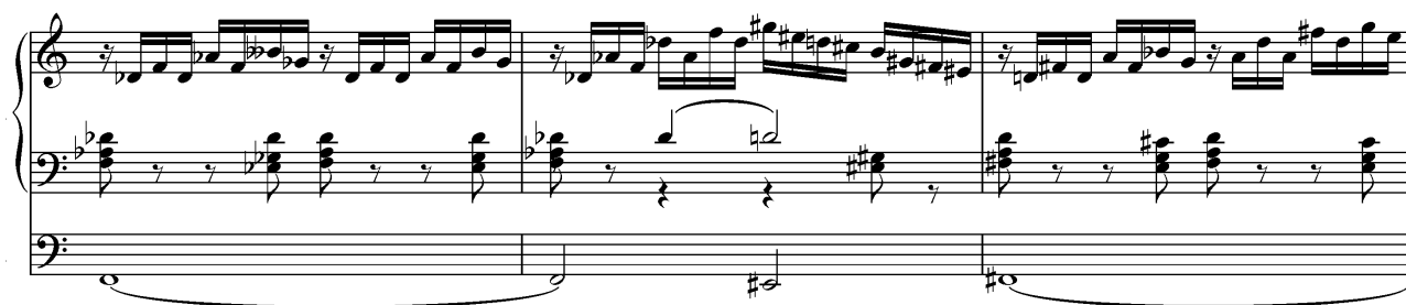
Kuva 2: Cesar Franck: Koraali a-molli, tahdit 149-151

tiarvot ovat paljon nopeampia. Tässä esimerkissä on sormiosatsin lisäksi myös soitettavaa jalkiolla. Oikean ja vasemman käden sekä jalkion stemmat ovat myös kaikki erilaisia verrattuna toisiinsa. Oikealla kädellä on nopeaa 16-osakuviota, vasemmassa kädessä on säästäviä sointuja kahdeksasosina ja jalkiossa on hitaasti säveleltä toiselle vaihtuva urkupiste. Kuvan 2 esimerkissä on myös huomattavasti enemmän tilapäisiä etumerkkejä kuin kuvan 1 esimerkissä. Esimerkin tonaliteetti muuttuu näiden kolmen tahdin aikana Des-duurista vähennettyjen sointujen kautta D-duuriin. Vaikka soinnut itsessään ovat vasemmassa kädessä melko helposti luettavissa, ei tällainen modulointi ole kaikista helpointa hahmotettavaa. Teoksen alkuperäinen sävellaji on kuitenkin a-molli, joten päätyminen Des-duuriin on jo loikkaus melko kauas alkuperäisestä tonaliteetista.