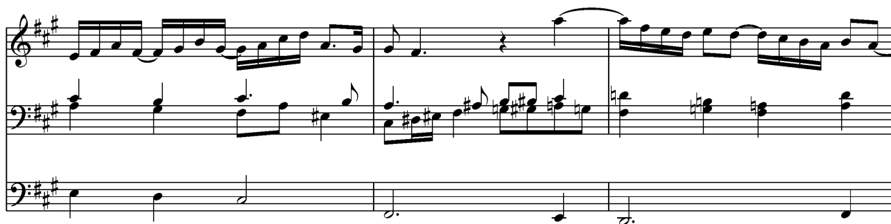
Kuva 7: César Franck: Koraali a-molli, tahdit 98-100