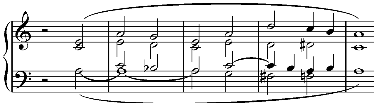
Kuva 1: César Franck: Koraali a-molli, tahdit 30-34

Jos esimerkiksi jos César Franckin a-mollikoraalia (FWV 40) analysoi yllä mainitulla tavalla, huomaa siitä pian helpolta näyttävät kohdat kuten esimerkin kuvassa 1. Mitkä komponentit tästä nimenomaisesta kohdasta tekevät siitä näennäisesti helpon? Ensinnäkin voi huomata, että kohta soitetaan pelkästään sormiolla: yksi nuottiviivasto hahmotettavaa. Nuottiarvot ovat myös lähinnä puolinuotteja, joten voidaan siis olettaa, ettei kohtaa tarvitse soittaa virtuoosin nopeasti. Nuottitekstuuri on myös koraalimaista, rytmikan ollessa samanlaista jokaisessa stemmassa. Vaikka esimerkissä on tilapäisiä etumerkkejä, ne ilmaisevat melko loogisesti edellisen sävelen korottamista tai alentamista.